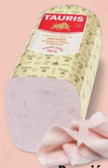
Premiér morčacia šunka