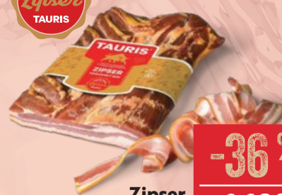
Zipser kráľovský bok