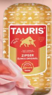
Zipser Šunka original