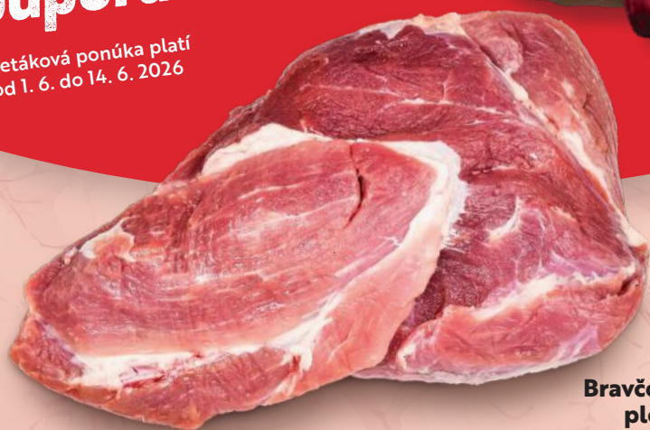
Bravčové plece bez kosti