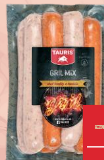
Gril mix, 500 g 5,98 €/kg